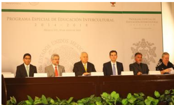
Figura 6. Programa Especial de Educación Intercultural 2014-2018

La Era de la Educación Intercultural (2011–2017) representó un avance hacia la consolidación de programas educativos. La Secretaría de Educación Pública, a través de la Coordinación General de Educación Intercultural y Bilingüe, implementó el Programa Especial de Educación Intercultural 2014–2018 (véase figura 6 ), cuyo objetivo fue fortalecer la atención educativa de las poblaciones indígenas y promover el enfoque intercultural en el sistema educativo (Gobierno de México, 2013). Durante este periodo también se impulsaron bachilleratos interculturales en distintos estados y se renovaron materiales escolares con participación de docentes hablantes. Paralelamente, las radios comunitarias y medios locales jugaron un papel relevante en la difusión cultural y lingüística, ampliando los espacios de uso de las lenguas fuera del aula.