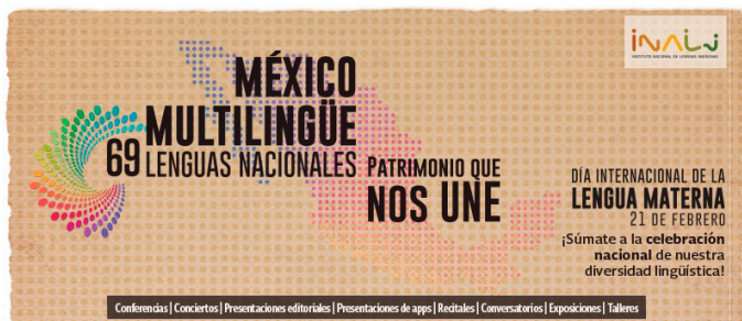
Figura 7. Lengua Materna

Finalmente, la Era de la Visibilización (2018–2025) se caracteriza por la expansión de campañas públicas y la incorporación de nuevas tecnologías. El INALI lanzó la estrategia México multilingüe (véase figura 7 ), mientras que organismos internacionales como la ONU declararon 2019 como el Año Internacional de las Lenguas Indígenas. La SEP también anunció la producción de Libros de Texto Gratuitos en 20 lenguas indígenas para el ciclo escolar 2023 (SEP, 2023). Además, el auge de redes sociales ha permitido que jóvenes hablantes produzcan contenidos digitales en sus lenguas, reforzando la participación social en la revitalización.