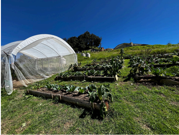
Figura 4. Huerto dentro del Centro de Desarrollo Comunitario, San José Cuacuilá. (2025).

El centro de Cuacuilá ha destacado por su compromiso con la comunidad y por el impacto positivo que ha generado en el desarrollo cognitivo y emocional de los niños. Una de sus principales fortalezas es que la mayoría de las educadoras son mujeres de la propia localidad, lo que refuerza la identidad cultural y garantiza que la enseñanza esté vinculada al contexto social y lingüístico de los alumnos. Sin embargo, su dependencia de donativos y la escasez de recursos gráficos y pedagógicos representan desafíos constantes para mantener y ampliar sus programas.