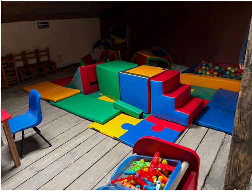
Figura 2. Ludoteca del Centro de Desarrollo Comunitario, San José Cuacuila. (2025)

positivos en el desarrollo cognitivo de los niños, quienes han demostrado avances notables en comprensión, razonamiento y habilidades matemáticas.